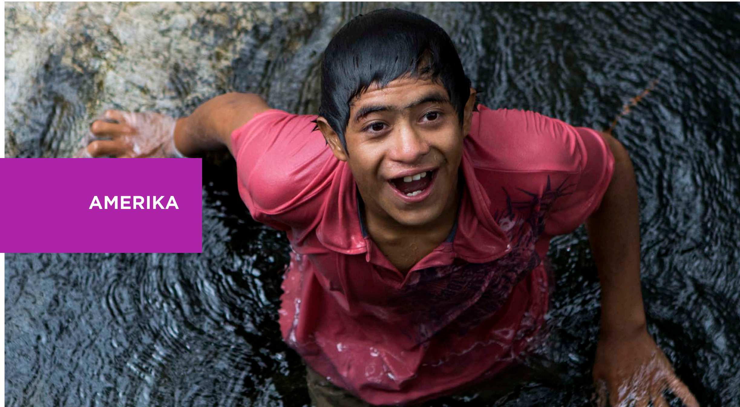
Ever, Chiapas, Meksiko