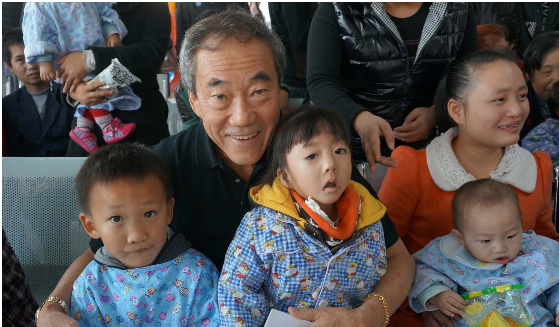
Charles B. Wang, menemui para pasien di China

Ini adalah salah satu foto favorit saya dari pendiri tercinta kami mendiang, Charles B. Wang. Foto ini juga menunjukkan betapa besarnya cintanya kepada organisasi ini dan setiap pasien sumbing. Tapi itu hanya menunjukkan sebagian kecil dari pengabdiannya untuk membantu setiap anak dengan kondisi bibir sumbing agar bisa tersenyum bahagia.