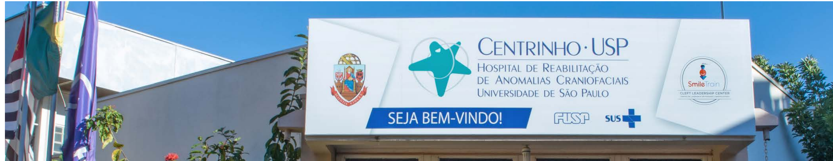
Pusat penanganan sumbing Smile Train HRAC - USP Centrinho Bauri di São Paulo, Brasil