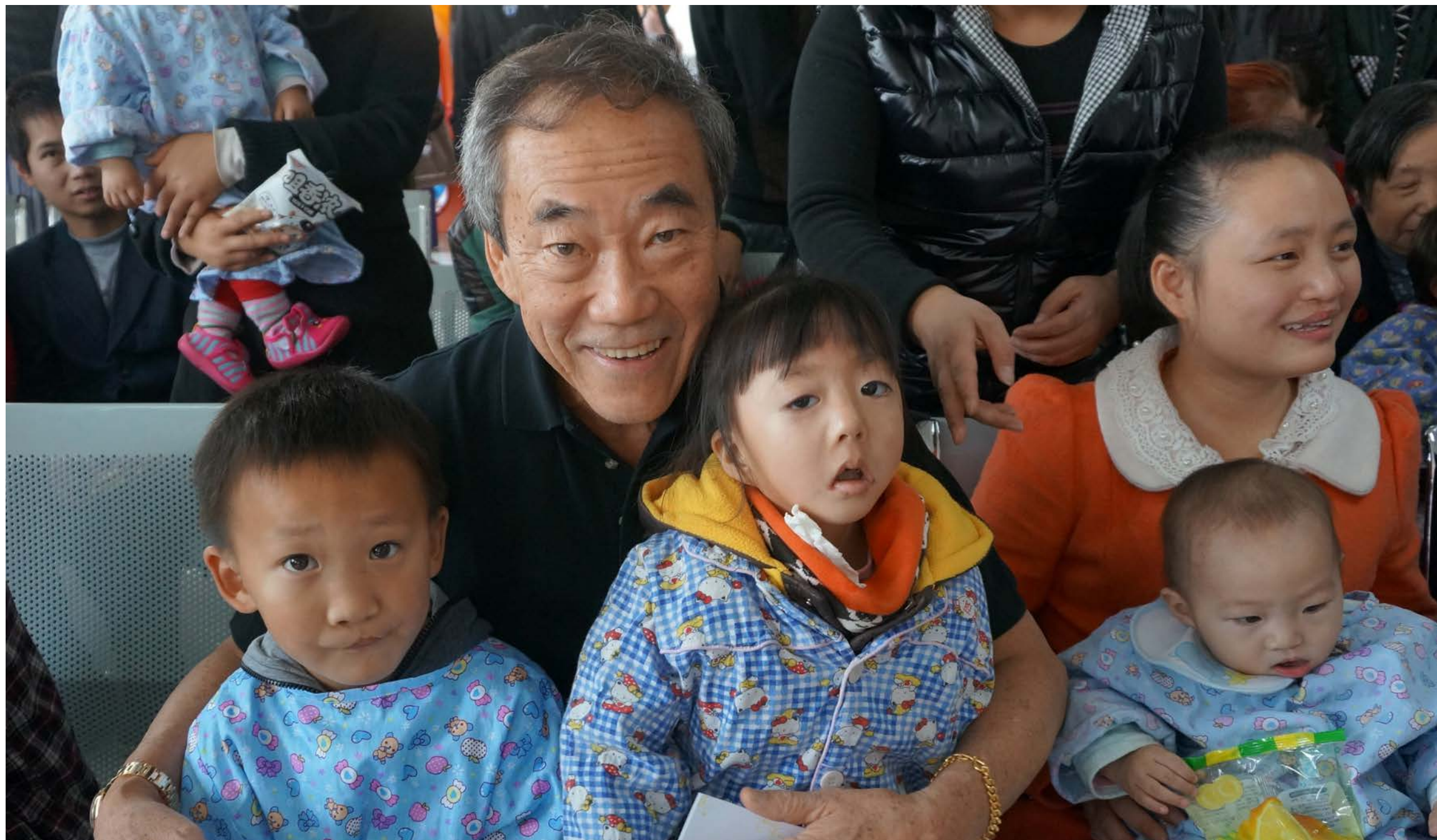
Charles B. Wang, en un encuentro junto a pacientes en China

Esta es una de mis fotos favoritas de nuestro difunto y querido fundador, Charles B. Wang. Ilustra muy bien cómo nuestros pacientes lo hicieron sentir, lleno de luz. Nos dice mucho sobre su amor por esta organización y por cada uno de sus pacientes, aunque ese es recién el comienzo de su devoción por ayudar a cada niño con fisura labio palatina a brillar con su sonrisa.