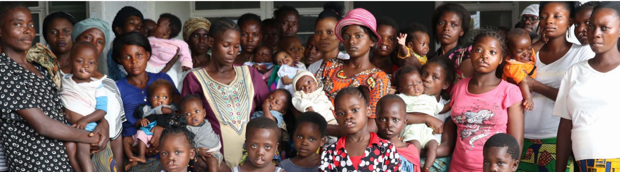
Hospital General Dipumba, República Democrática del Congo

A menudo, las personas con fisura labio palatina, especialmente las de los países de ingresos bajos y medios, no pueden opinar sobre las políticas que afectan sus vidas. Smile Train hace que sus voces sean escuchadas. Nuestros representantes ponen la sensibilización sobre la fisura labio palatina en la agenda global, incluyendo el activismo en la Asamblea Mundial de la Salud y la Asamblea General de la ONU. Los miembros de nuestro personal regional forjan relaciones con los gobiernos y socios locales para promover los derechos de las personas con fisura labio palatina, especialmente el derecho a una atención médica segura y de calidad que hace posibles muchos otros derechos, como la educación y la independencia económica.